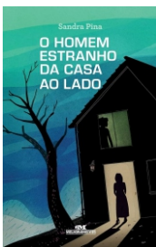
Título: O HOMEM ESTRANHO DA CASA AO LADO Autor(a): Sandra Pina Editora: Melhoramentos