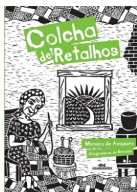
Título: COLCHA DE RETALHOS Autor(a): Moreira de Acopiara Editora: Melhoramentos